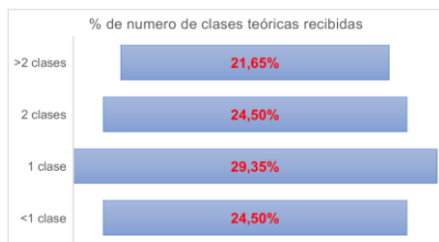
Grafica 2: % de numero de clases teóricas recibidas