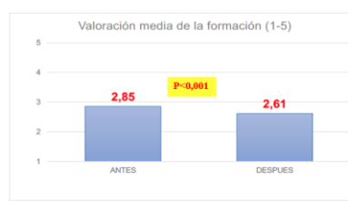
Grafica 1: Valoración (1-5) de la formación teórico-práctica en EVC recibida